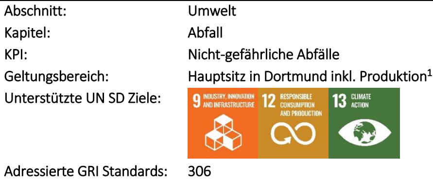
Nicht-gefährliche Abfälle (t)