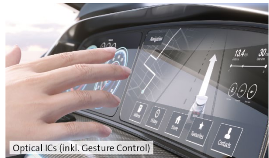
Optical ICs (inkl. Gesture Control)

Als einer der Pioniere in der Gestenerkennung im Auto ermöglichen Elmos Gesture Control ICs eine intuitive, berührungslose und präzise Bedienung des Cockpits. Dadurch wird der Fahrer bei der Bedienung des Displays oder anderer Funktionalitäten weniger abgelenkt und kann sich besser auf den Verkehr konzentrieren, was die Fahrsicherheit deutlich erhöht. Seit mehr als zehn Jahren sind Gesture Control ICs von Elmos bei namhaften Automobilherstellern weltweit im Einsatz und sorgen so in Millionen von Autos für mehr Sicherheit, Komfort und User Experience.